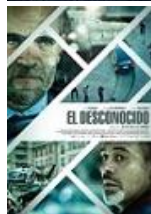
EL DESCONOCIDO Director: Dani de la Torre Atresmedia Cine (en coproducción)