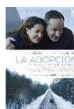
LA ADOPCIÓN Director: Daniela Fejerman Tornasol Films (en coproducción)