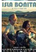
ISLA BONITA Director: Fernando Colomo Coca-Cola Iberian Partners, Camba Films (en coproducción)