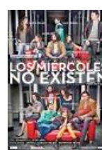
LOS MIÉRCOLES NO EXISTEN Director: Peris Romano José Frade PC