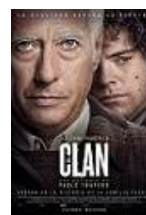
EL CLAN Director: Pablo Trapero El Deseo, Telefónica Studios (en coproducción)