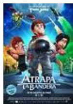
ATRAPA LA BANDERA Director: Enrique Gato Lightbox Entertainment, Telecinco Cinema, Telefónica Studios, Los Rockets AIE (en coproducción)