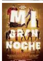
MI GRAN NOCHE Director: Alex de la Iglesia Enrique Cerezo PC, Telefonica Studios