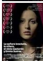
LA SEÑORA BRACKETS. LA NIÑERA. EL NIETO BASTARDO Y EMMA SUÁREZ Director: Sergio Candel Lekanto Studio (en coproducción)