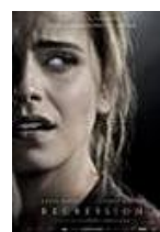
REGRESIÓN Director: Alejandro Amenábar Telecinco Cinema, Mod Producciones, Telefónica Studios, Himenóptero (en coproducción)